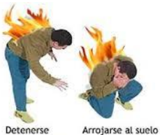
Detenerse Arrojar al suelo